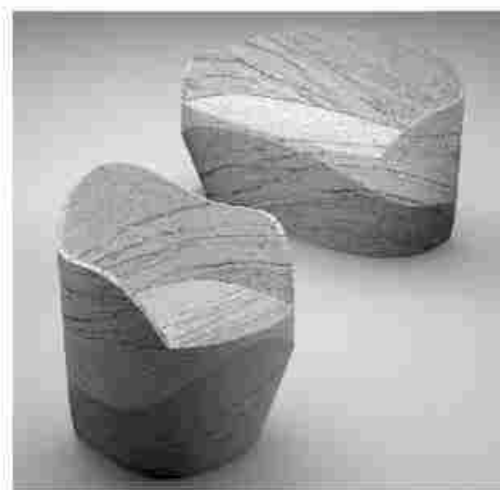
DUO - DESIGN: RAFFAELLO GALOTTO - COMPANY: TESTI GROUP

Sono tre le mostre che saranno ospitate nella Hall 1 dell'edizione 2017 Marmomac. La prima porta il nome di «Territorio&Design», intende approfondire le tematiche legate al progetto di design litico evidenziando le peculiarità dei materiali dei diversi territori e bacini produttivi della penisola, valorizzandone i contenuti tecnici della tradizione e il patrimonio culturale. Si tratta di una mostra di prodotti e oggetti di arredo indoor e outdoor realizzati con le tecnologie più innovative e utilizzando al massimo le potenzialità dei materiali. «Macchine Virtuose», è la seconda mostra che si rivolge alle aziende dei materiali, della trasformazione e della tecnologia, alle quali sarà proposta la realizzazione di un prodotto che metta in risalto le potenzialità di lavorazione con finalità produttive e commerciali, da qui anche la novità dell'abbinamento con le aziende di design e arredo. Infine «Soul of City», è un