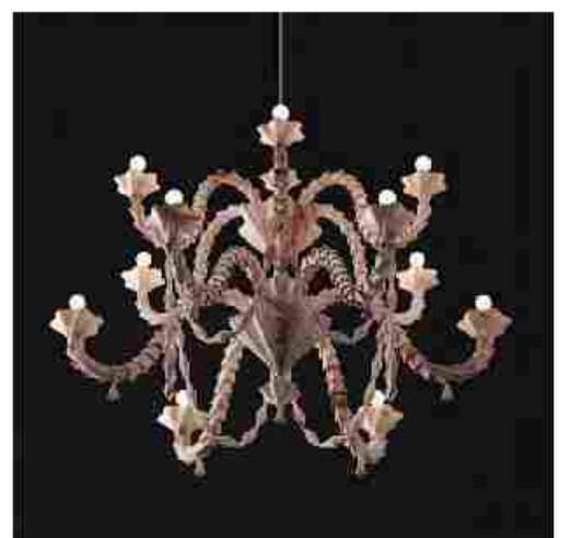
REZZONICO - DESIGN: RAFFAELLO GALOTTO - COMPANY: INTERMAC

Alcune opere che dimostrano la versatilità della pietra e del marmo sapientemente lavorati