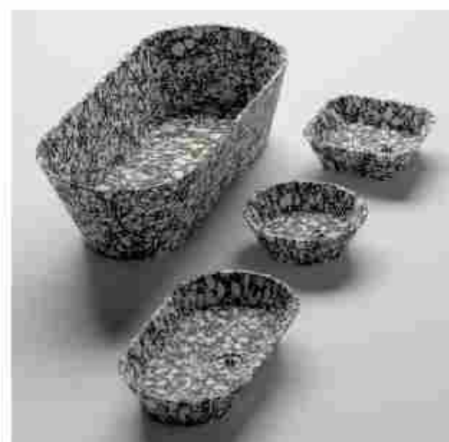
EASY - DESIGN: RAFFAELLO GALOTTO - COMPANY: VICENTINA MARMI