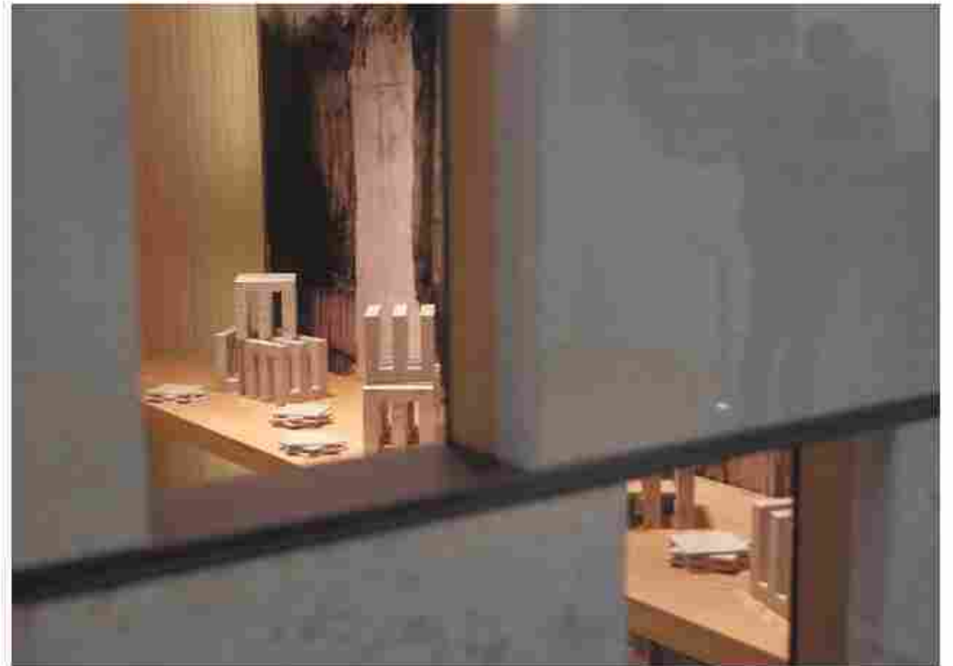
All'edizione del 2016 di Marmomac hanno partecipato 67 mila operatori, per il 60 per cento stranieri